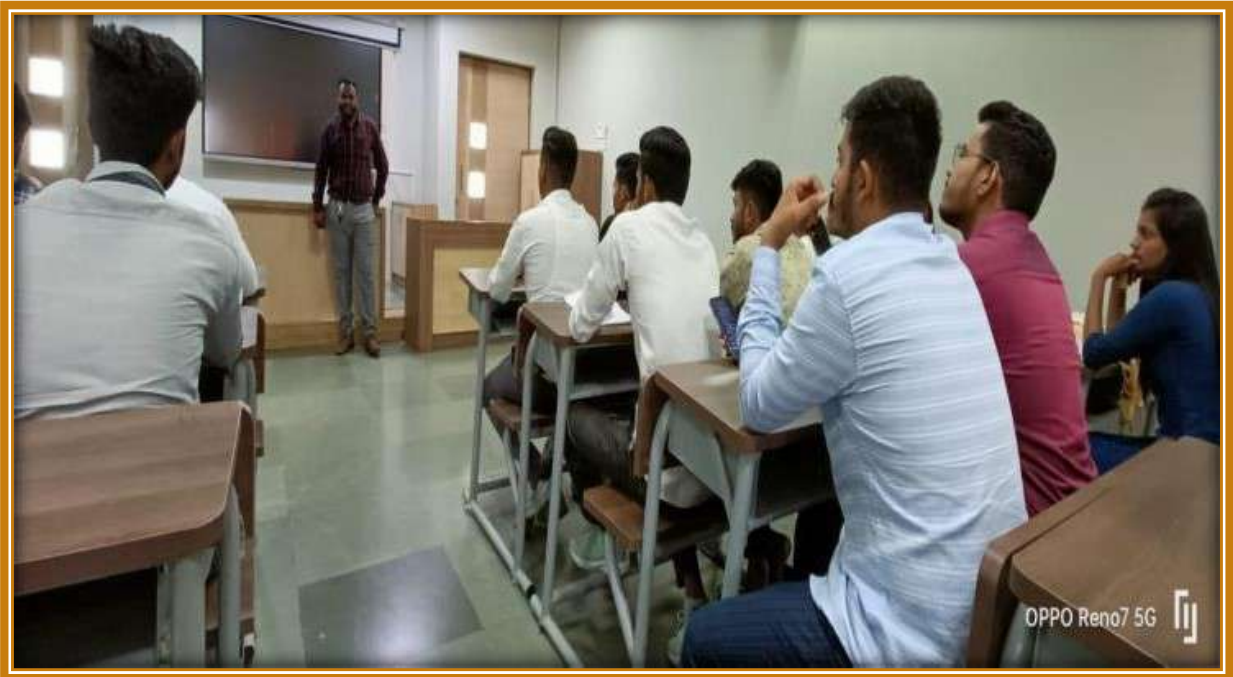
Pre Placement talks by HR Just Dial