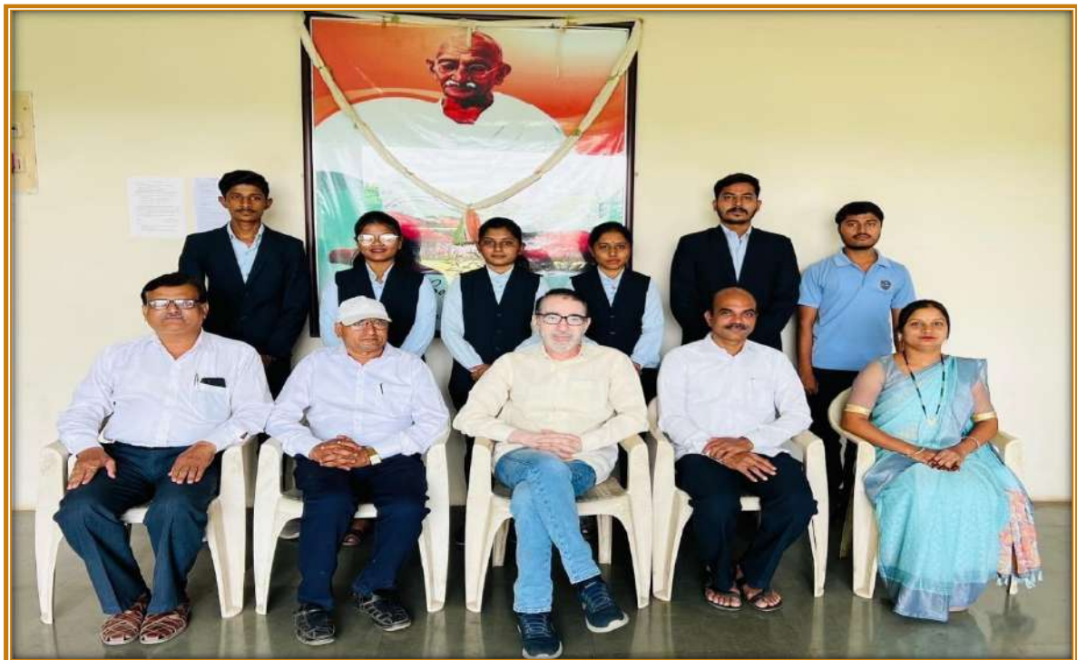
Students Selected in Infosys IT and BPM.