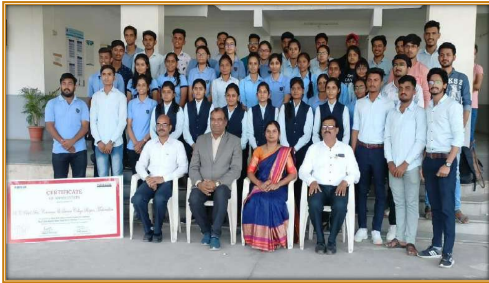
Students in Employability Skills Training with Trainer and TGP Cell