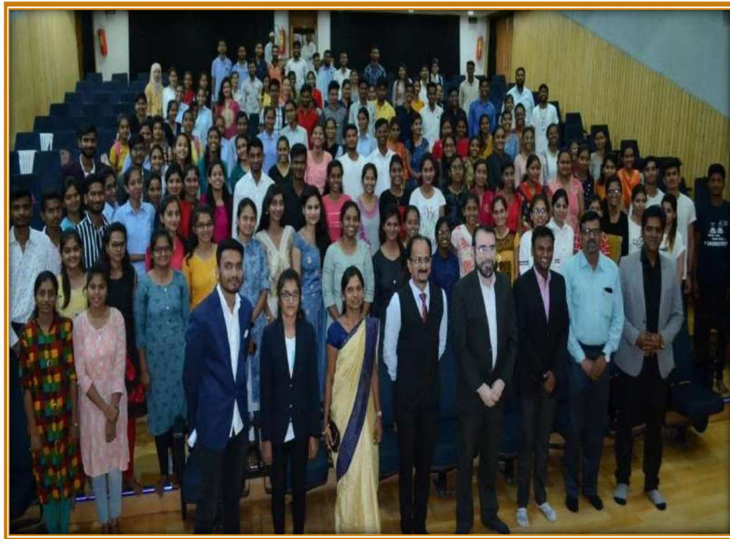
Team- Trainer and Students for the Training of 'Connect to work' by Rubicon