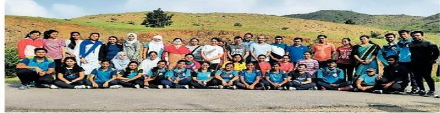
शिरपूर तालुक्यात सातपुड्याच्या डोंगरात ट्रेकिंग करताना शिरपूर आर. सी. पटेल कॉलेजचे विद्यार्थी व प्राध्यापक.